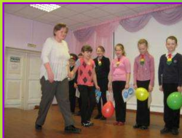
Акция «Дети - взрослым» «Как дорогу перейти – у внука с внучкою спроси» (II место)