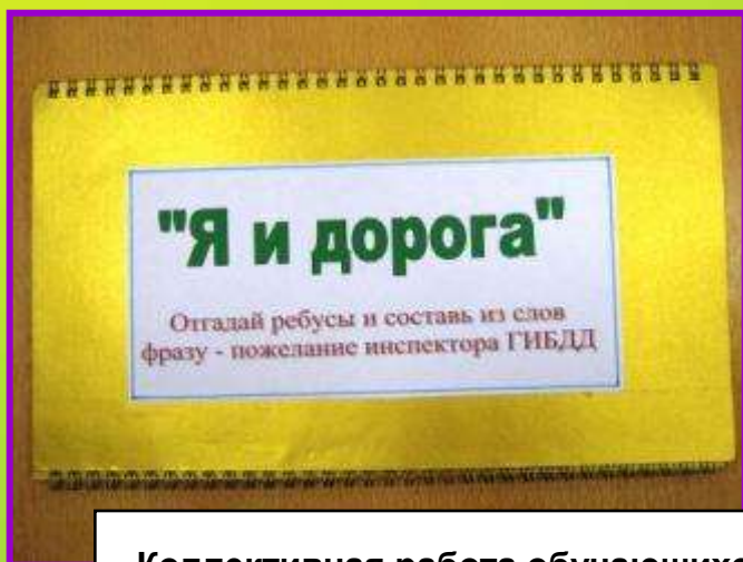
Коллективная работа обучающихся 2 в класса (II место)