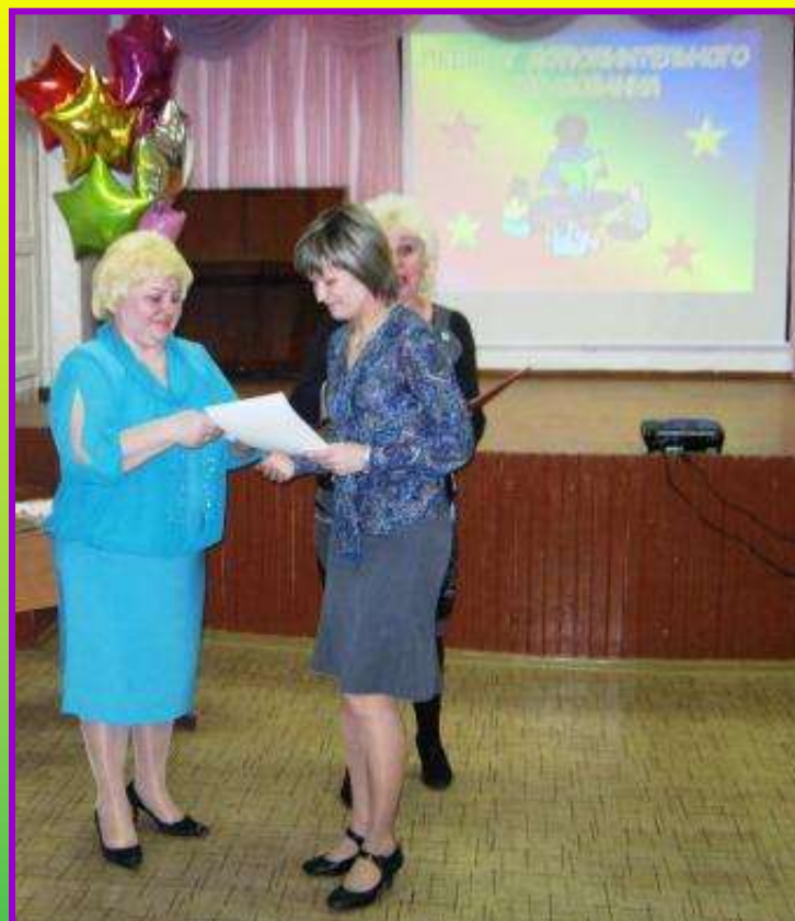
Победа в школьном конкурсе «Юбилей зажигает звёзды» в номинации «Лучший педагог дополнительного образования» (2012г.)