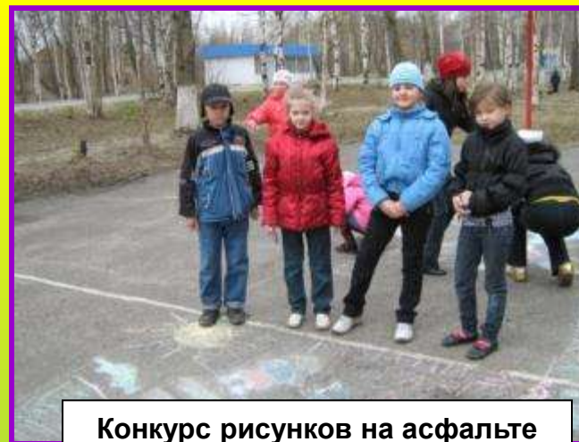
Конкурс рисунков на асфальте «Дорожные ловушки»