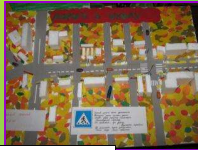
Городской конкурс макетов «Дорога в школу»