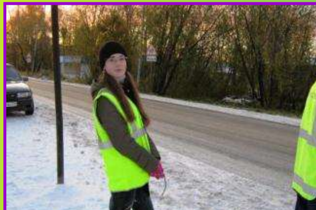
Дежурство на перекрёстке у школы с инспектором «Аваркомсервис»