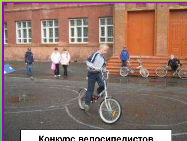
Конкурс велосипедистов «Весёлая змейка»