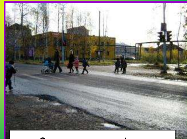
Экскурсия к светофору