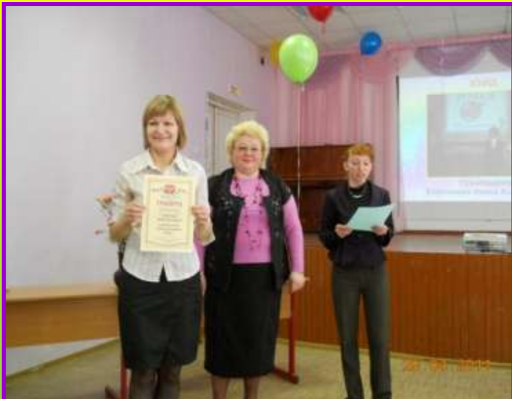
Конкурс «Звездопад школьных талантов» Активный участник творческого объединения «ЮИД» (2011г.)