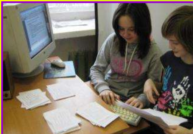
Подведение итогов акции «Пешеходный переход: повезёт – не повезёт»