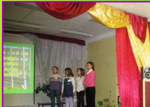
Городской слёт отрядов ЮИД