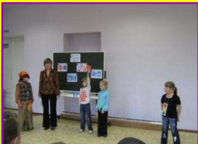
Игровая программа по ПДД «Дорожные приключения Бабы Яги»