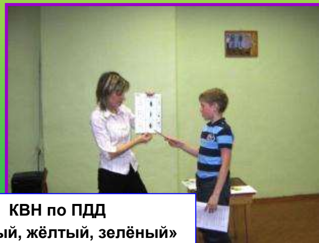
КВН по ПДД «Красный, жёлтый, зелёный»