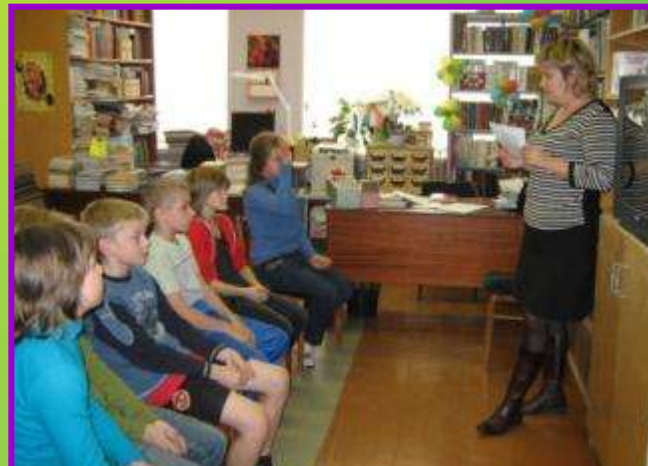
Кинолекторий по ПДД «Азбука безопасности» в школьной библиотеке