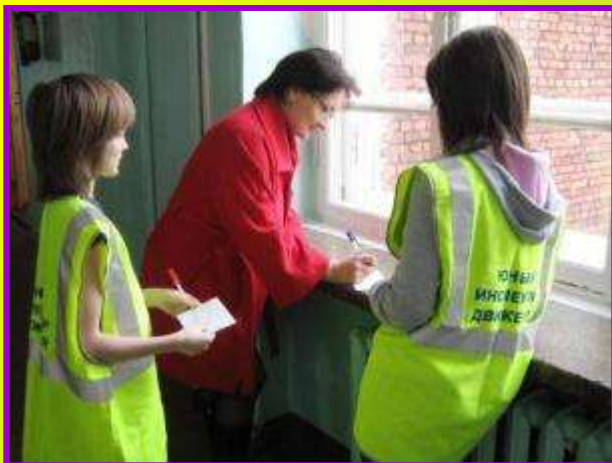
Акция «Пешеходный переход: повезёт – не повезёт»