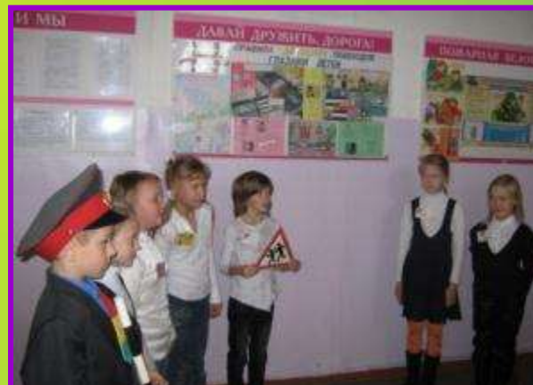
Защита фотовитрины «Берегите на дороге руки, головы и ноги!»