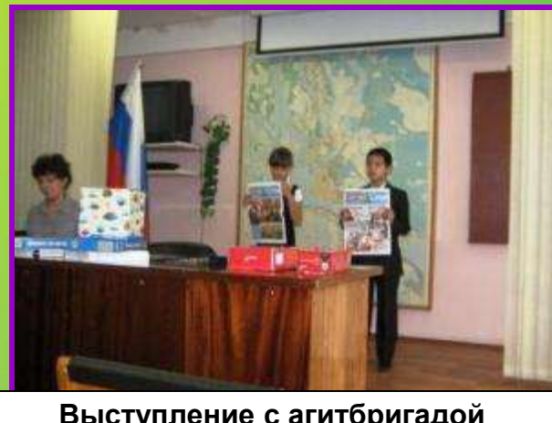
Выступление с агитбригадой в ГИБДД