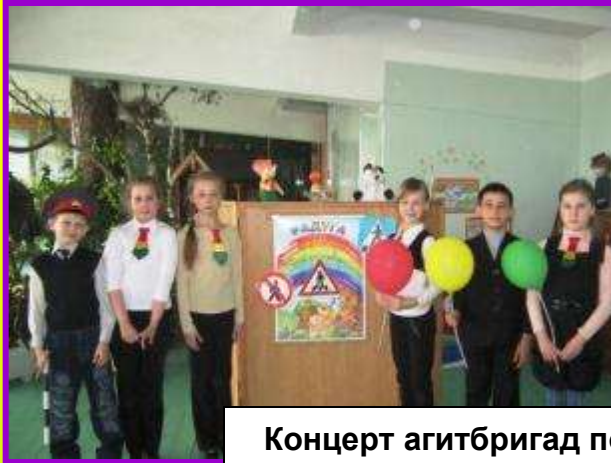
Концерт агитбригад по ПДД для воспитанников МДОУ «Буратино идёт в школу»