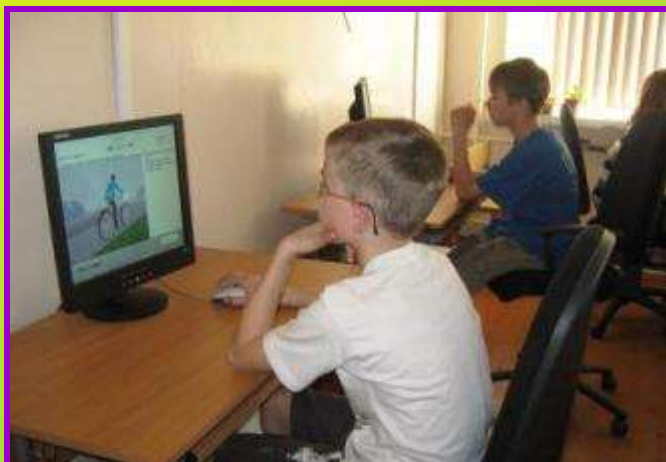
Тестирование в режиме Онлайн на тему: «Правила поведения велосипедистов»