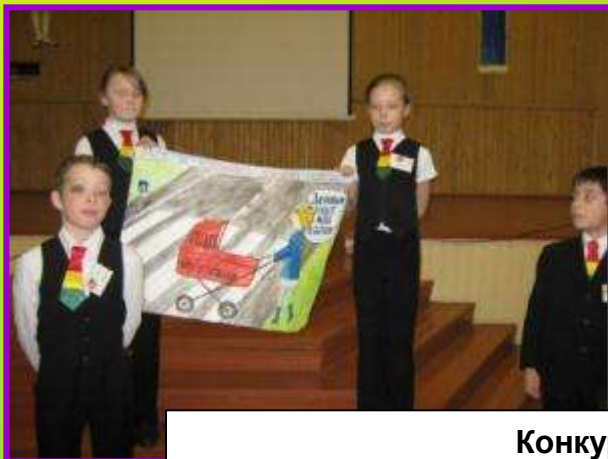
Конкурс плакатов «Вместе за безопасность дорожного движения» (I место)