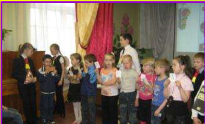
Праздник для первоклассников «Посвящение в пешеходы» в МБОУ СОШ № 52