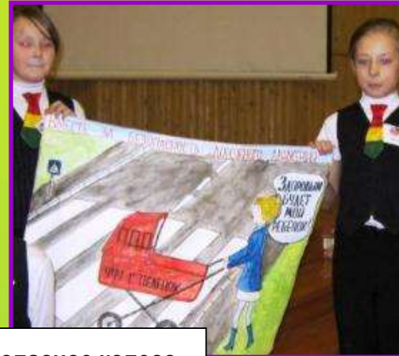
Соревнования «Безопасное колесо»