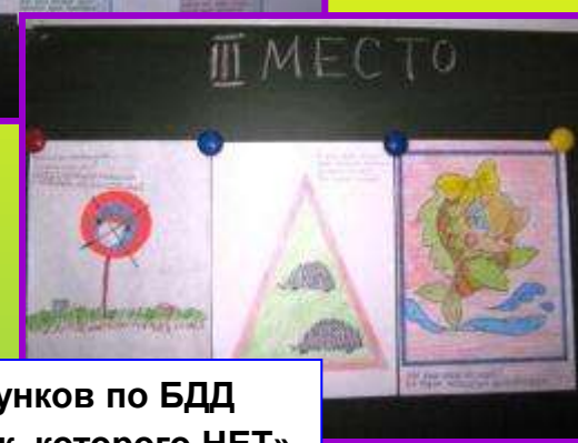
Конкурс рисунков по БДД «Дорожный знак, которого НЕТ»