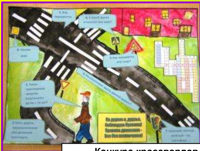
Конкурс кроссвордов и ребусов по ПДД «Я и дорога» Коллективная работа творческого объединения ЮИД (I место)