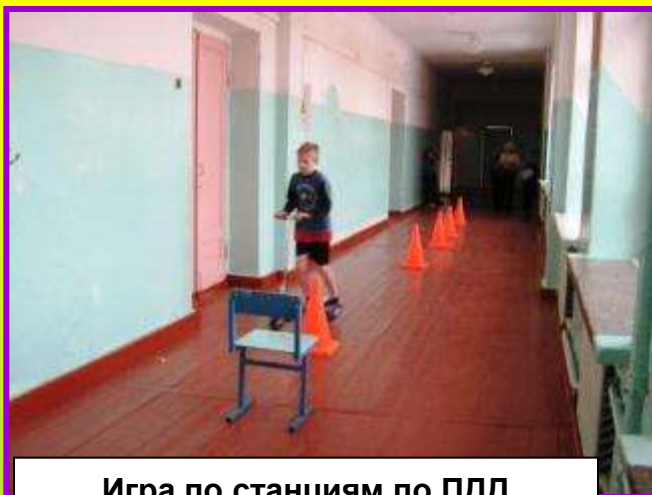
Игра по станциям по ПДД «Большая безопасная прогулка»