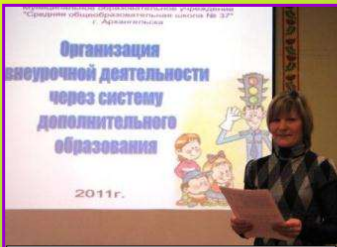
Выступление на городском семинаре в МБОУ СОШ № 37