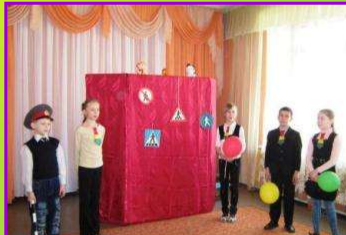
Театрализованное представление для воспитанников МДОУ «Знай правила дорожного движения»