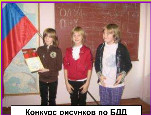
Конкурс рисунков по БДД «Внимание – дети!» (I место)