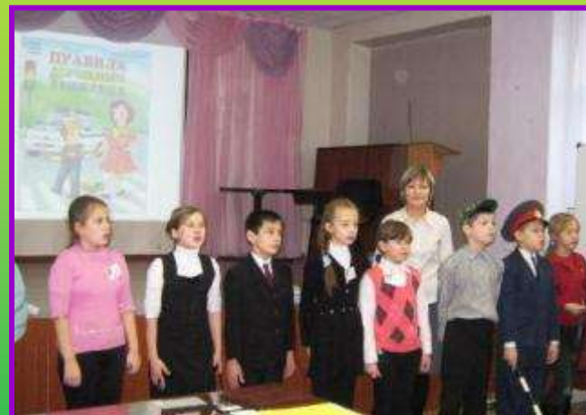
Праздник для первоклассников МБОУ СОШ № 37 «Посвящение в пешеходы»