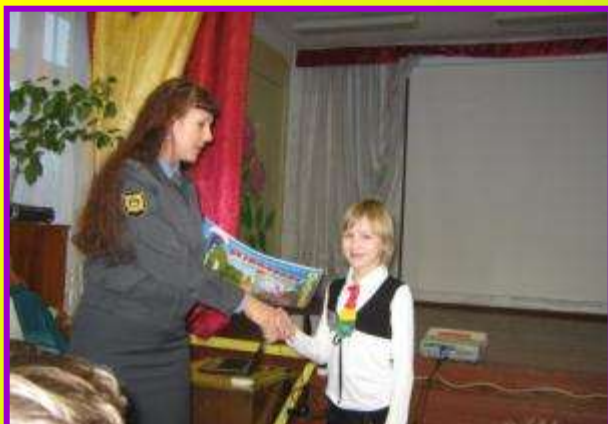
Слет отрядов ЮИД «Союз ЮИД – ГИБДД предупреждает ДТП»