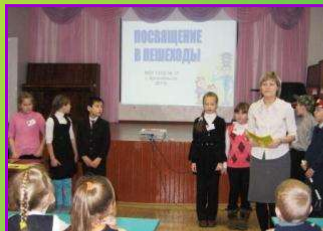
Праздник для первоклассников МБОУ СОШ № 37 «Посвящение в пешеходы»