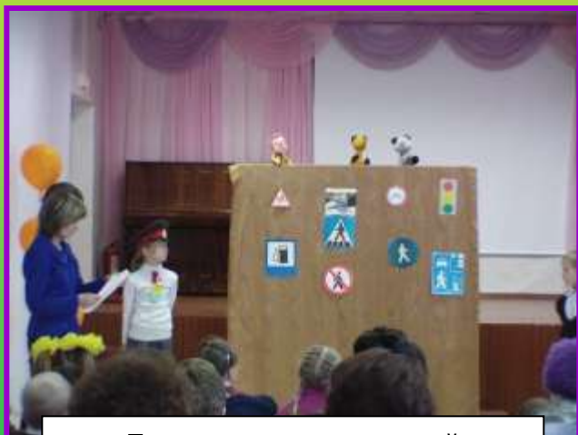
День открытых дверей для будущих первоклассников